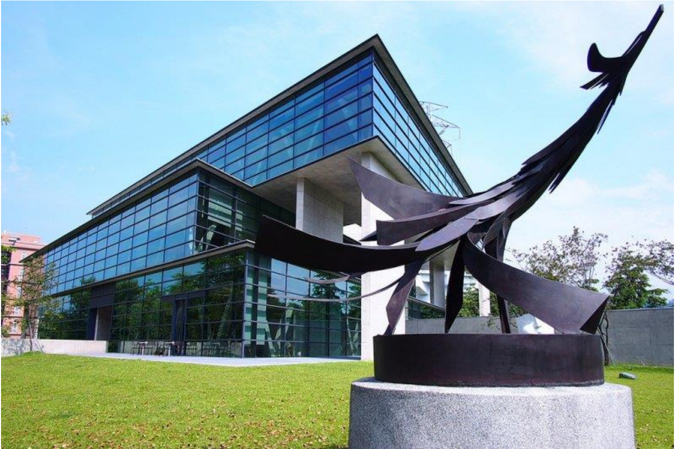
圖：中國時報舉辦「大專校院校園風景網路人氣票選」亞大安藤美術館入選全台校園十大美景！