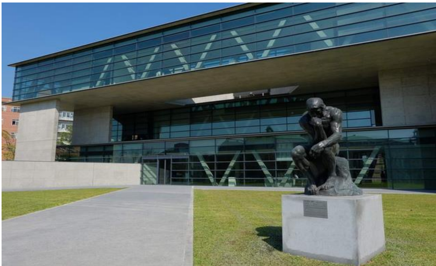
圖：中國時報舉辦「大專校院校園風景網路人氣票選」亞大安藤美術館入選全台校園十大美景！